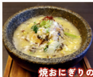
焼おにぎりの 海鮮あんかけ 900円