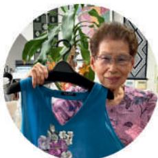
洋装 志ののめ 〔問合せ〕 0940-33-1129

長かった夏 やっと秋らしくなりました。 今から秋冬物をデザインしています。 エプロンや、さらりと羽織りやすい 刺繍入りの上着などございます。