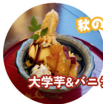
大学芋&バニラアイス 550円