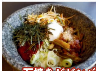
石焼きビビンバ 900円