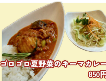
ゴロゴロ夏野菜のキーマカレー 850円