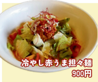
冷やし赤うま担々麺 900円